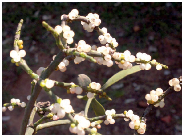
Fig. 2. Phoradendron obtusissimum , “ka'avo tyre'y”, detalle de la planta.

Las hojas son suculentas, de color verde claro; de forma elíptica-curvada a lanceolada, borde entero, ápice redondeado, base cuneada. Nerviación de tipo actinódroma, con 5 venas principales, de las cuales las 3 más internas son evidentes y las dos marginales son menos patentes, todas parten de la base y se dirigen hacia al ápice, pero no llegan a él.